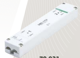
70-021 DALI modul DBC-1/TH