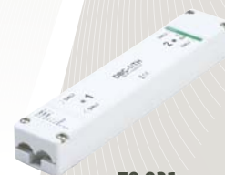
70-021 DALI modul DBC-1/TH