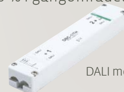
70-021 DALI modul DBC-1/TH