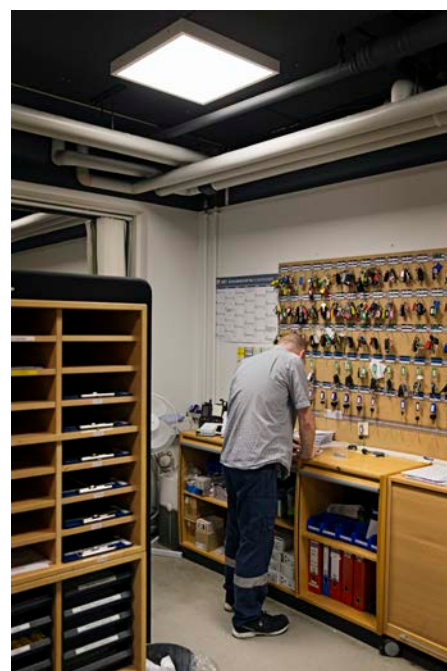
LED-armaturer giver optimal belysning for at se detaljer.